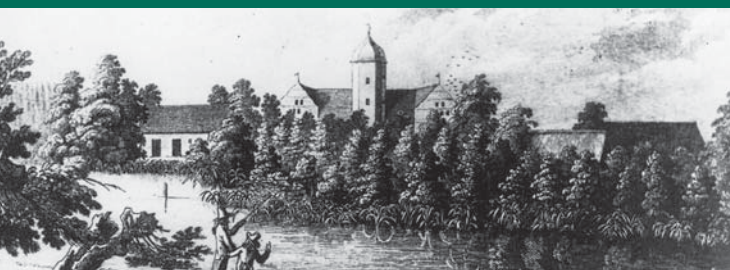
WASSERSCHLOSS QUILOW, STICH VON 1792