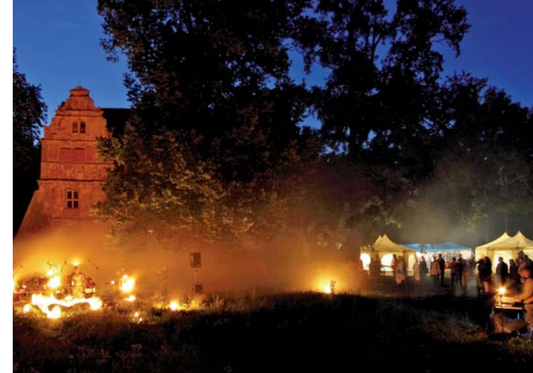
FEUER-GESANG-PERFORMANCE VOR DER SCHLOSSKULISSE, 2009