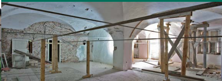
TONNENGEWÖLBTE HALLE, ERDGESCHOSS

Spendenbescheinigungen (ab 200 Euro beim Finanzamt erforderlich) können ausgestellt werden. Bitte Name und Anschrift mitteilen.